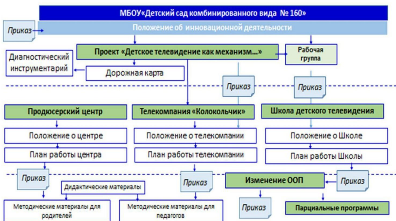
Рисунок 2. Нормативная модель реализации проекта

Для создания системы детского телевидения на основе федеральных законодательных актов разработан нормативный блок модели, который описывает правовой алгоритм реализации модели посредством создания разнообразных локальных актов (приказов о создании рабочей группы по реализации проекта, об утверждении парциальной программы, различных положений, дорожной карты проекта, планов работ Продюсерского центра, Детской Телекомпании, Школы детского телевидения положений; об утверждении методических и дидактических материалов для родителей и педагогов).